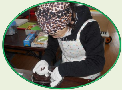
バレンタインデー

1月から3月にかけて、豊浦やまと光星園では 色々な行事を行いました。 一泊旅行、外食、温泉入浴、バレンタインデー、 ホワイトデー、節分等々 その様子を写真で紹介していきます。