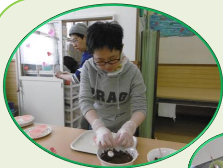
バレンタインデー

2月14日にやまと郭公の里ハーモニーにてバレンタインデーのお菓子作りを行いました。女性利用者全員でマシュマロに溶かしたチョコをつけてチョコマシュマロを作りました。チョコをたっぷりつける人、控えめにつける人皆さんそれぞれの個性が出て楽しく行えました。出来上がったチョコマシュマロは15時のおやつに利用者さん全員に配り皆さんで美味しくいただきました。(西原)