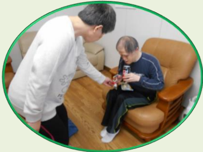
バレンタインデー