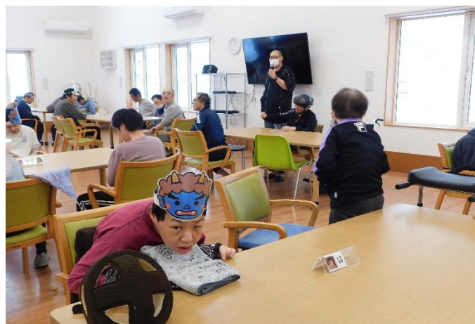
定期総会後の節分豆まきの様子！